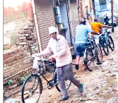
नारनौल। मोहल्ला में टूटी सड़क पर बहते पानी से गुजरते लोग।

टूटी सड़के, बंद नालियां, बहता पानी, ओवरफ्लो सीवरें, पानी तीन चार दिन में एक बार आना। यह नजारा शहर के प्राचीनतम इलाकों में से एक मोहल्ला चांदुवाड़ा का है। शहर के मुख्य मार्ग तालाब बहादुर सिंह से प्रमुख बाजार मानक चौक, आजाद चौक, बजाजा बाजार को जाने वाला मुख्य मार्ग मोहल्ला चांदुवाड़ा से होकर गुजरता है। जहां पर रहने वाले स्थानीय निवासी, दुकानदार व प्रतिदिन इस व्यस्त मार्ग से गुजरने वाले सैकड़ों राहगीर व वाहन चालकों के लिए इस दुर्गम मार्ग को पार करना एक जंग जीतने जैसा हो गया है।