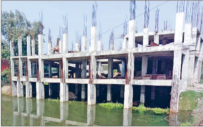
नारनौल। नागरिक अस्पताल में बनाया जा रहा है नया भवन व नए भवन में टेकेदार द्वारा कई महीनों से जाला गया सामान।

जिला स्तरीय नागरिक अस्पताल भवन काफी पुराना है और कंडम भी हो चुका है, लेकिन स्वास्थ्य विभाग के पास नया भवन नहीं होने के कारण इसी पुराने भवन में अस्पताल चलाया जा रहा है। इस कमी को जब प्रदेश के सीएम मनोहर लाल खट्टर थे, तब नारनौल प्रवास के दौरान उनके समुख यह डिमांड रखी गई थी। जिस पर 3 नवंबर 2017 को उन्होंने विधानसभा का शीतकालीन सत्र शुरू होने से एक दिन