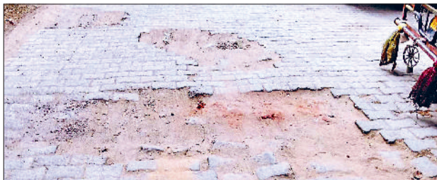
महेंद्रगढ़। जर्जर अवस्था में स्टेट हाईवे ककी जाने वाला मार्ग।

शहर के मोहल्ला बास से स्टेट हाईवे-148बी तक एक किलोमीटर लंबे सड़क मार्ग का चार माह के समय में नवनिर्माण किया जाएगा। नगर पालिका की ओर से इसके लिए 37.40 लाख रुपये का बजट तय किया है। यह मार्ग काफी लंबे समय से जर्जर अवस्था में है। सड़क जर्जर होने के चलते आने-जाने वाले राहगीरों को काफी परेशानियों का सामना करना पड़ रहा था। सड़क का निर्माण होने से राहगीरों व वाहन चालकों को काफी फायदा मिलेगा। एक किलोमीटर सड़क के नव निर्माण का कार्य को पूरा करने के लिए चार माह की समय-सीमा निर्धारित की गई है। बता दें कि यह मार्ग इंटरलॉकिंग टाइलों