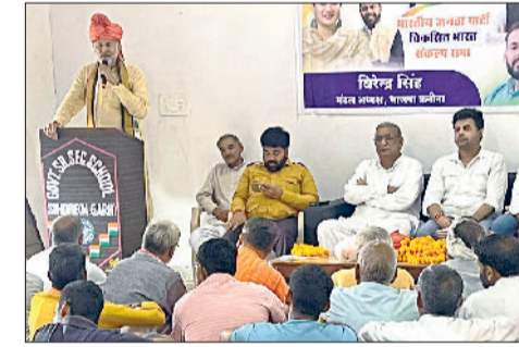
कनीना। सिहोर में आयोजित संगोष्ठी में संबोधित करते पूर्व मंत्री प्रो. रामबिलास शर्मा।

रामबिलास शर्मा ने कहा कि आज पूरी दुनिया प्रधानमंत्री नरेंद्र मोदी के नेतृत्व में भारत की विकास गाथा और दूरदर्शी नीतियों को देखकर हतप्रभ है। उन्होंने कहा कि वर्तमान सरकार ने विभिन्न क्षेत्रों में उल्लेखनीय योगदान दिया है। भारत दुनिया की चौथी सबसे बड़ी अर्थव्यवस्था बन गया है। सरकार ने