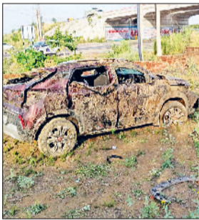
नारनौल। हाइवे पर पलटी कार।