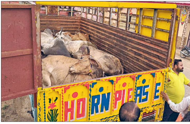
नारनौल। राजस्थान में पकड़ी गई आयर गाड़ी में गोवंश।

रही। संदिग्धों ने गोरक्षा दल की टीम पर रास्ते में कई जगह पत्थर भी बरसाए। इस बीच गोवंश से भरी गाड़ी को राजस्थान के मांडन क्षेत्र में पकड़ा गया। गाड़ी में सवार सभी भाग गए। गोवंश की इस गाड़ी को वहां की पुलिस के हवाले कर शिकायत दे दी गई है।